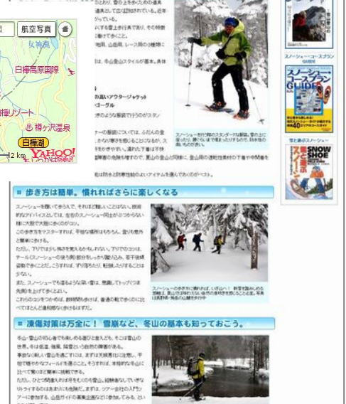
特集「スノーシューで冬を楽しむ」ラフイメージ