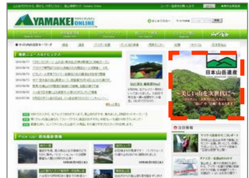
ヤマケイオンライン トップページ

登山情報サイト「ヤマケイオンライン」は、2010年4月にスタートした登山情報サイトです。山と溪谷社に日々集まる山のニュースを雑誌とは違うスピード感で情報提供しています。 この「ヤマケイオンライン」の冬の特集企画として、11月15日より、特集「スノーシューで冬を楽しむ(仮)」を掲載いたします。 この特集内に、宿泊施設・アウトドアガイドカンパニーを対象にした連合広告企画を初めて実施します。 どうぞこの機会に「ヤマケイオンライン」でのPRをご検討ください。