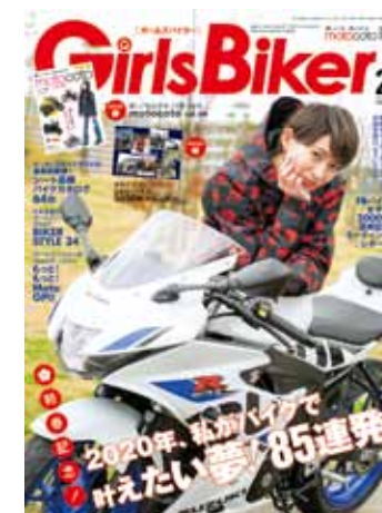
単車倶楽部 毎月24日発売 定価890円