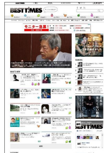
BEST TIMES TOPページ PC