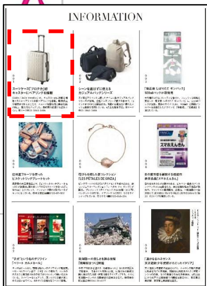
誌面掲載イメージ