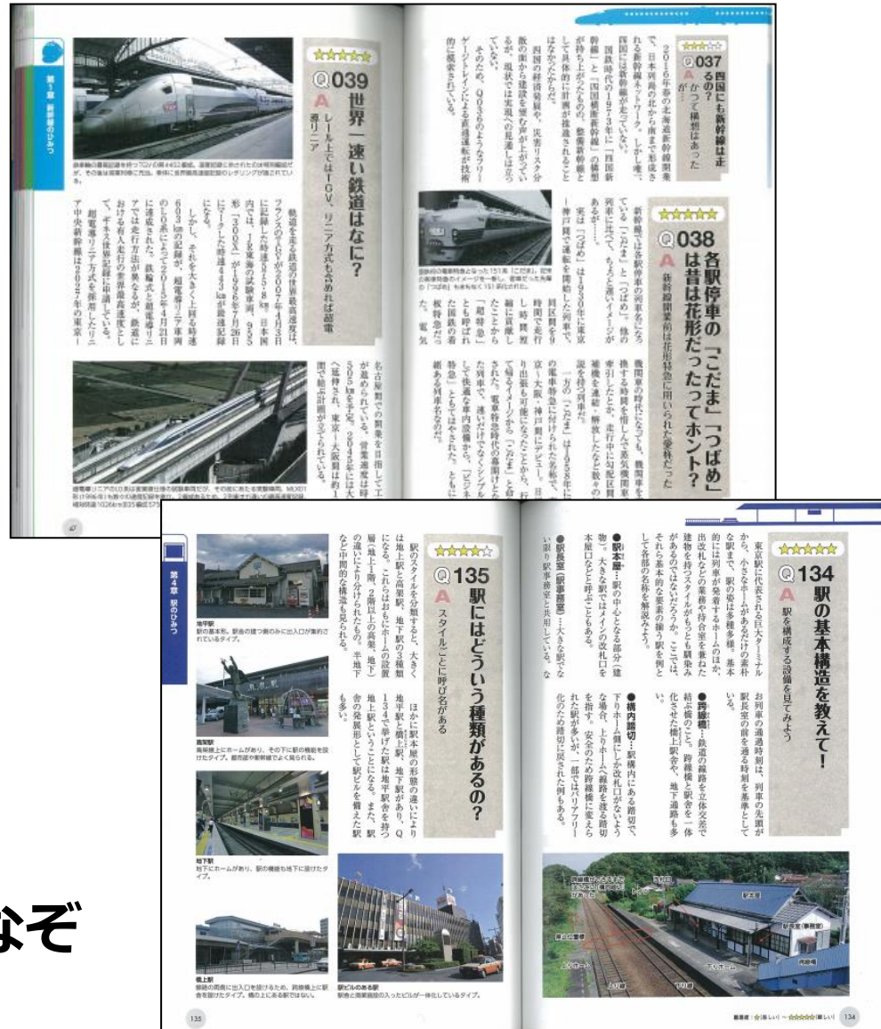
※画像は「鉄道200のひみつ」です。