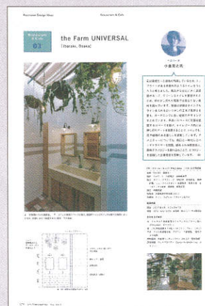
※掲載イメージ(1ページ)

*写真は、ご提供いただいた製品写真や施工例写真を使用します。 *紹介用記事は、弊社にて作成します。