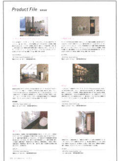
▲月刊商店建築 誌面掲載例

プロダクトファイルでは、号毎に決められたテーマに沿った最新の製品情報を1ページあたり6点のスペースで紹介いたします。掲載内容は、製品写真(1点)、製品紹介文(200字以内)、会社情報、資料請求番号を掲載します。