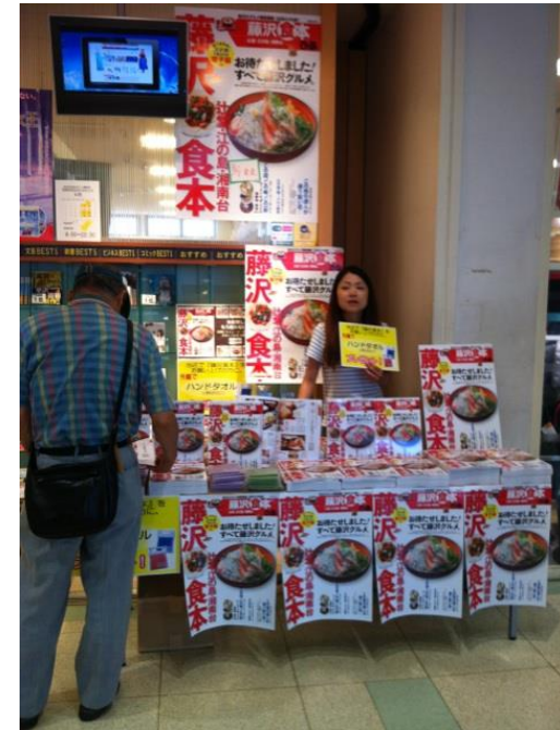
● 藤沢食本の展開事例