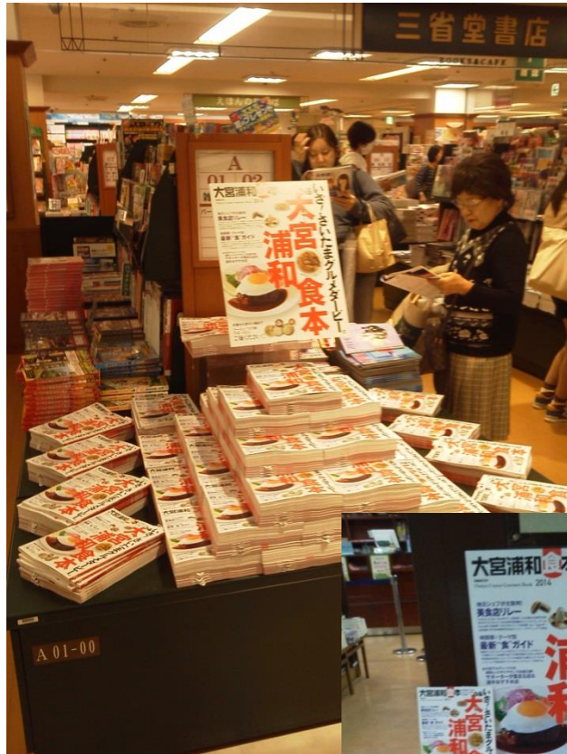
● 大宮浦和食本の展開事例