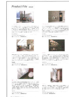
▲月刊商店建築 誌面掲載例

プロダクトファイルでは、号毎に決められたテーマに沿った最新の製品情報を1ページあたり6点のスペースで紹介し、掲載内容は、製品写真(1点)、製品紹介文(200字以内)、会社情報、資料請求番号を掲載します。Webサイト「PRODUCT INFORMATION」にも半年間掲載します。