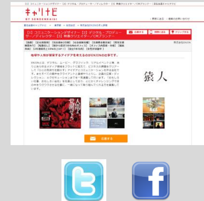
Web求人情報&ソーシャルメディア