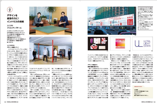
カラー2ページの記事