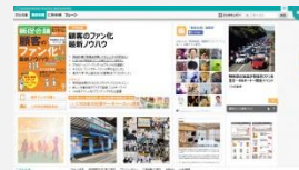
デジタル版(電子ブック)