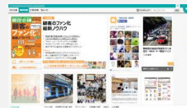
デジタル版(電子ブック)