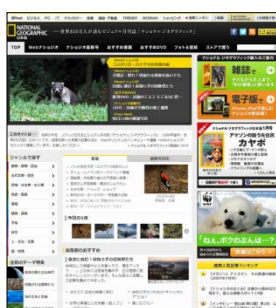
ナショナル ジオグラフィック 日本版 公式サイト