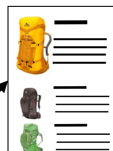
各社様タイアップサイト

アウトドアの特設サイトを開設、 参画各社の記事をWeb化して 掲載、貴社のサイトにリンクを はります。