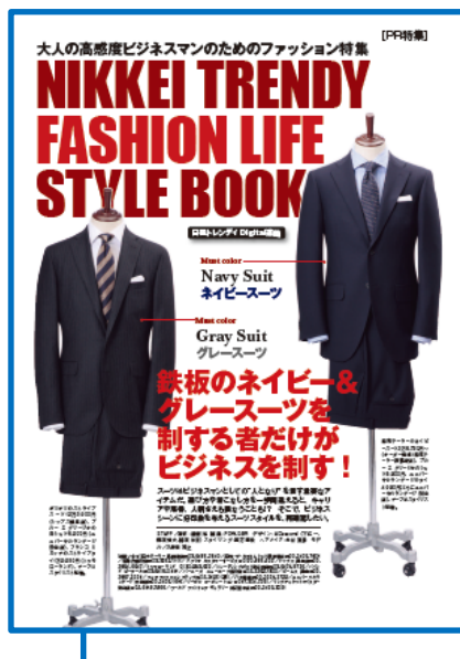
日経トレンドィ本誌

日経トレンドィ誌面(読者約15万人)の内容を日経トレンドィDigital版でも(無料アプリDLユーザー約40万人が閲覧可能)展開し、 誌面では見せることのできない別カットの写真(ディテールや裏側など)も紹介 。読者へのファッション情報を充実させ購買意欲を刺激します。