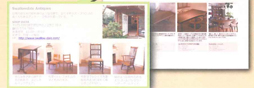
クリックで個別ページへジャンプ