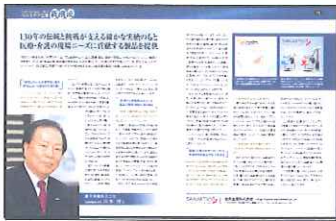
●トップインタビュー