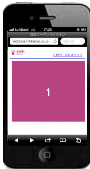
【ウェルカムページ】