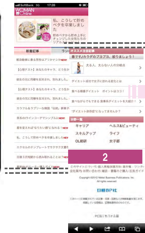
【トップ&amp;記事ページ】