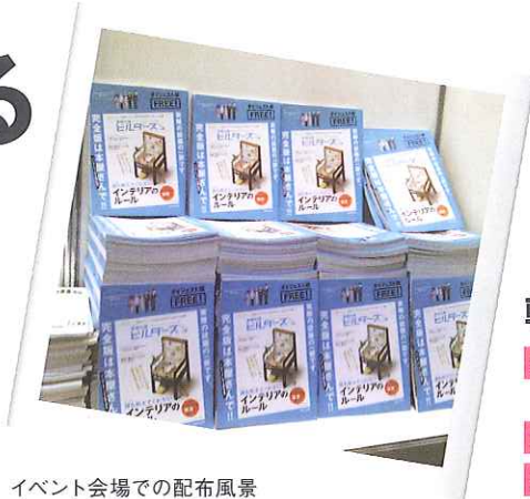
イベント会場での配布風景

月刊『建築知識』5月号(4/20発売)や『MyHOME+』VOL.28(4/21発売)とのセット料金もご用意しております! 詳細は営業担当にお問い合わせください。