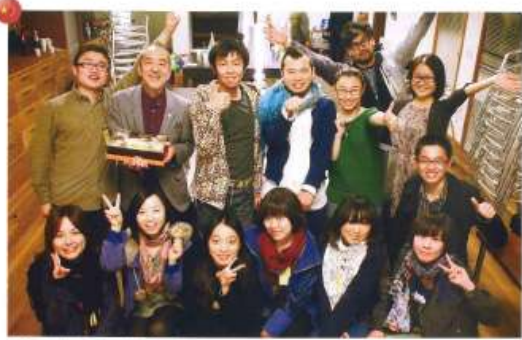
本企画の制作プロダクションとエージェンシー、プロダクションとエージェンシーのメンバーの写真を大きく配置し、取材させていただきます。

左ページ プロダクションと、 エージェンシーの、 メンバーの写真を、 大きく配置し、 取材させていただきます。