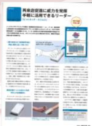
■サービスの概要を紹介する誌面 （説明中心）