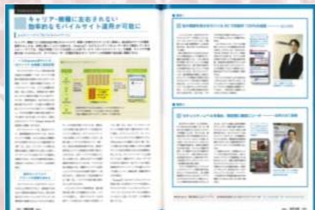
■サービス概要+お客様事例の 両方を紹介する誌面