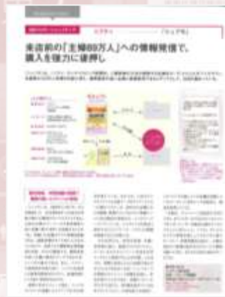
■サービスの概要を紹介する誌面 （図解中心）