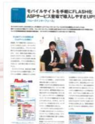
■お客様との対談形式によって サービスの魅力を伝える誌面