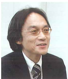
日経メディカル 編集長