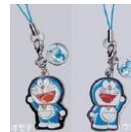
(新旧デザインの携帯ストラップ)