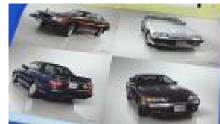
(本誌綴じ込みポスター)