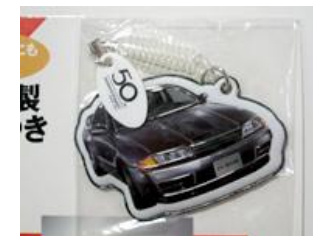
(ローソン限定 付録)