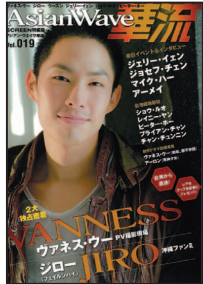
AW vol.19 (6.22発売) 表紙・ヴァネス・ウー

誌名 ■ SCREEN特編版 Asian Wave 華流 vol.20 発売日 ■ 2010年9月16日 体裁 ■ A4判(天地297ミリ×左右210ミリ) 予価 ■ 本体1,800円+税 発行部数 ■ 50,000部 次号 ■ 12月16日発売予定