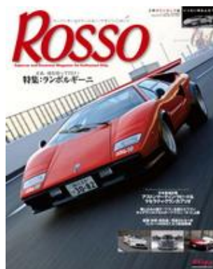
ROSSO(ロツソ: 毎月26日発売)