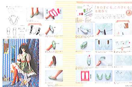
Vol.11より「本日開店16シューズ工房」作業工程を写真を丁寧に解説

お人形やお人形のお洋服、家具、小物など、お人形ファンが作りたい手作り情報がいっぱいです。写真やイラストでのステップバイステップでの作り方説明や型紙、より自分らしい表現へのヒントなど、手作りへの扉を開く親切な情報がたっぷりです。