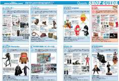
旧Quatoショップガイドイメージ

弊社制作担当が制作。広告制作を主にしているスタッフなので誌面とのマッチングは問題ありません。