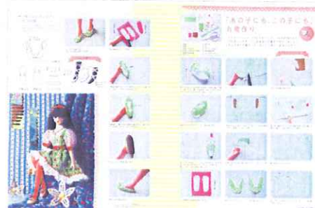
Vol.11より「本日開店1/6シューズ工房」作業工程を写真と丁寧に解説

お人形やお人形のお洋服、家具、小物など、お人形ファンが作りたい手作り情報がいっぱい。写真やイラストでのステップバイステップでの作り方説明や型紙、より自分らしい表現へのヒントなど、手作りへの扉を開く親切な情報がたっぷりです。