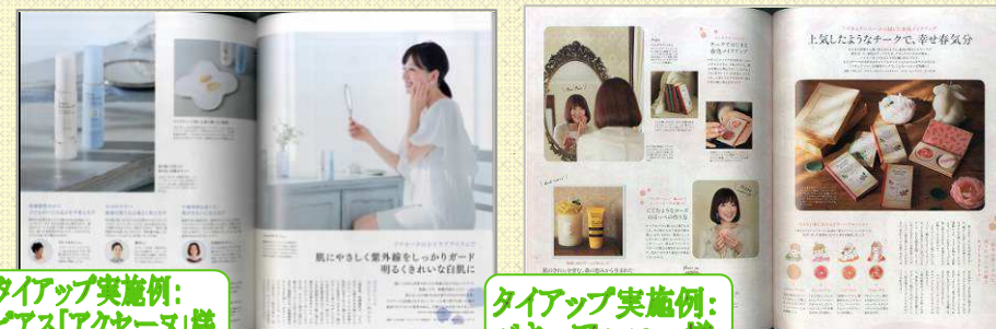
タイアップ実施例： ピアス「アクセーン」様