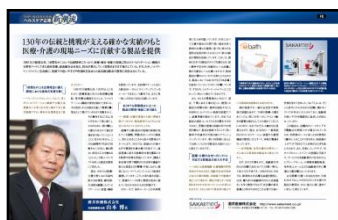
● トップインタビュー