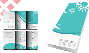
Magazine | Catalog