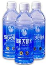
ペットボトル ウォーターの場合