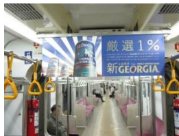
中吊り広告イメージ