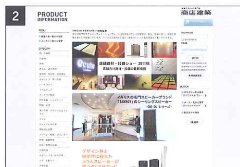
画面中央の本企画の画像をクリック