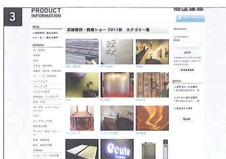
カテゴリー一覧が表示されます。