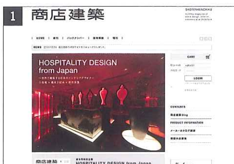
画面右「PRODUCT INFORMATION」のメニューをクリック