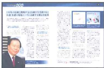
●トップインタビュー