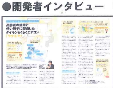
●開発者インタビュー