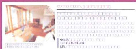
※上記の画面はイメージです

住空間設計を実現する製品やサービスを紹介するコーナーで、広告をご出稿いただく企業様の製品を紹介します。(1/4ページ程度)