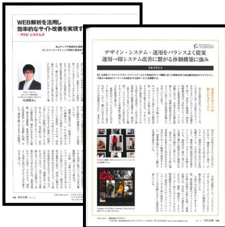
3.EC戦略パートナー紹介