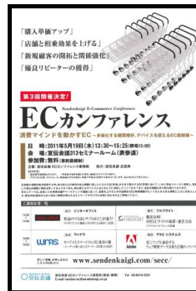
4.ECカンファレンス告知