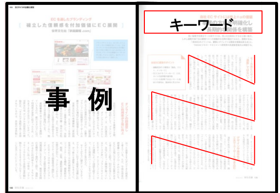
2.キーワードから読み解く改善ポイント