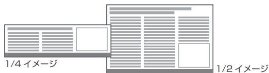
製品ガイドスペース 定型フォーマットイメージ