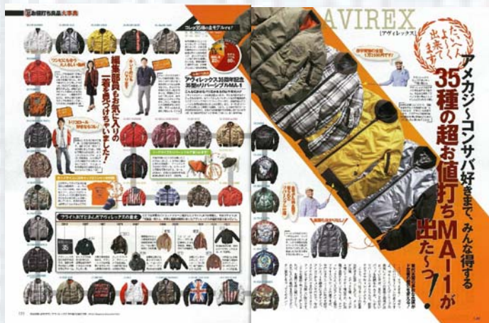
< 2 ページ例 >