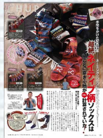
< 1 ページ例 >